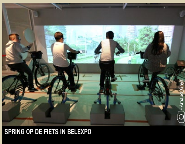
SPRING OP DE FIETS IN BELEXPO

Composteren op school, biodiversiteit op de speelplaats, schoolmoestuin, gezonde tussendoortjes en een Zero Afval-boekentas: milieueducatie begint thuis en gaat verder op school. Op dit vlak speelt het Brussels Hoofdstedelijk Gewest een pioniersrol. Er bestaan tal van hulpmiddelen voor projecten rond milieueducatie. Onder impuls van Bubble, het netwerk van scholen die zich inzetten voor het milieu, breidt deze beweging zelfs uit naar jeugdbewegingen en jeugdhuizen die projecten opzetten of het milieu in hun activiteiten inpassen. De school kleurt groen, met de leerkrachten als centrale spil.