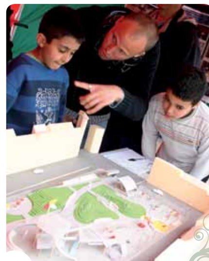
➤ Het speelplein van het Bonneviepark werd mee uitgedacht door de bewoners.

Het participatief proces is er bijgevolg voor en door iedereen: "Iedereen heeft iets te zeggen. Iedereen heeft zo zijn eigen mening, of die nu positief of negatief is. De kennis zit bij de lokale inwoners. Ik woon daar niet, dus ik weet niet wat er daar moet gebeuren. Ik ben louter de tussenpersoon tussen de overheid en de behoeften van de gebruikers, en ik probeer de verwachtingen van de gebruikers correct door te geven aan de landschapsarchitecten. We vertrekken van een lege bladzijde en we