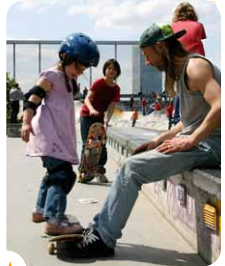
Het Ursulinenplein behoort toe aan iedereen.