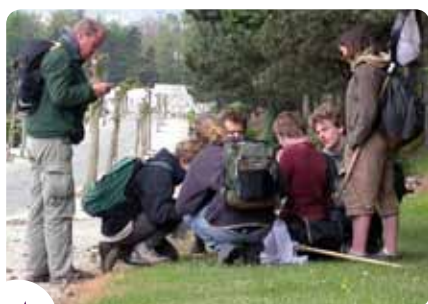
Vrijwilligers observeren de natuur op de begraafplaats van Verrewinkel in Ukkel.