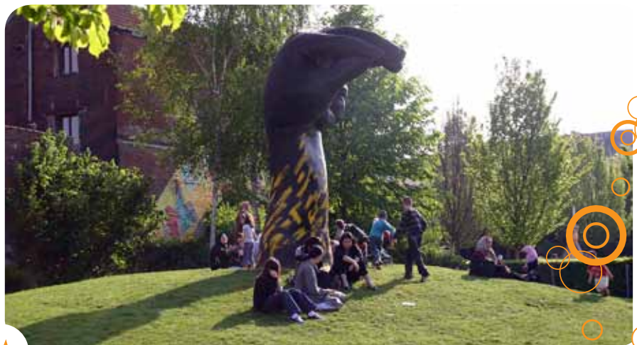
Het Dauwpark is meer dan een grasperk en bakjes, het is een levensruimte.

Meer weten? Filmpjes die de activiteiten en de projecten van de dienst 'Ontwikkeling en participatie' voorstellen vindt u op www.leefmilieubrussel.be > Particulieren > Groene ruimten en biodiversiteit > Levende parken.