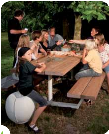
In sommige door Leefmilieu Brussel beheerde parken vindt u voortaan zo'n picknicktafel.

Zodra de zomer in het land is, begint het picknickseizoen, met de daarbij horende geruite dekentjes en rieten manden. Leefmilieu Brussel zal in juni twintig prachtige, op-en-top duurzame picknicktafels installeren in zijn parken. Unieke plaatsen waar u kunt genieten van een mooie dag, waar u vrienden kunt ontmoeten of waar u een picknick kunt organiseren. Maar hoe houdt u uw picknick milieuvriendelijk?