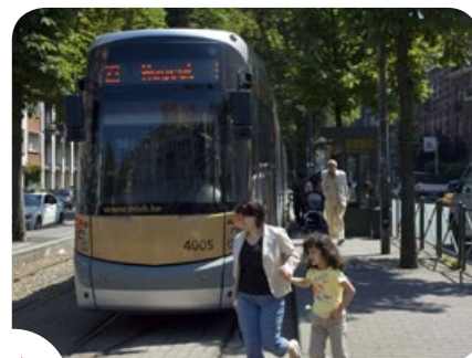
Een piek? Laat uw wagen thuis...

Het heeft geen nut om de vogels te vroeg in de herfst te beginnen voederen, als de temperaturen nog niet onder nul duiken. Overvloedige en herhaaldelijke regenbuien of vorst zijn uitstekende aanwijzingen om te starten met het voederen van vogels. Leg in het voederbakje regelmatig kleine hoeveelheden vogelzaad en -granen (van verschillende soorten) die u in de winkel kunt vinden. Zorg dat het zaad zich niet opstapelt, zodat het niet beschimmelt, vochtig wordt of bederft. En stop zeker niet met voederen in het midden van de winter, want de vogels in uw buurt zijn intussen gewend geraakt aan de energiebron die u voor hen voorziet. Bouw het voederen stelselmatig af naarmate de dagen weer mooier beginnen te worden.