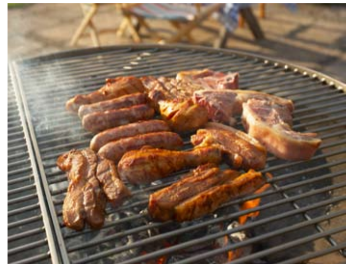
Er zijn alternatieven voor vlees