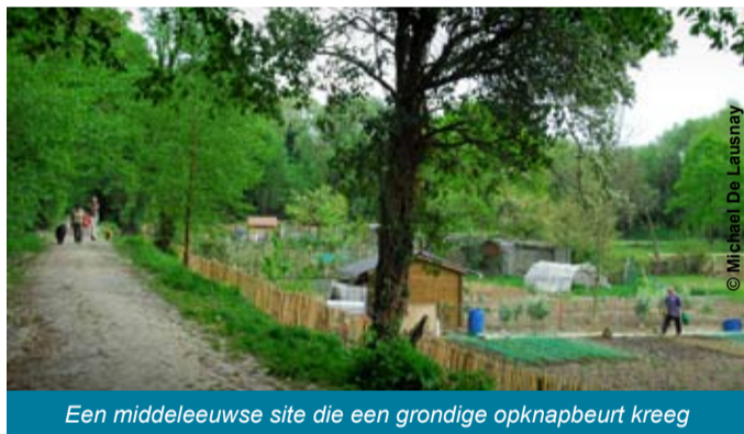
Een middeleeuwse site die een grondige opknapbeurt kreeg

De Keyenbemptstraat, een onderdeel van de Groene Wandeling rond Brussel, doorkruist deze site als een geplaveide ruggengraat. Een dwarsweg in lavagrind leidt naar het westen van het park, naar het moerasige gedeelte. Daar hebt u van op twee houten vlonders een mooi uitzicht over het moeras en kunt u in de verte zien hoe verschillende mensen druk in de weer zijn met het wieden, schoffelen, planten en onderhouden van hun moestuintje. Tussen de verbouwde percelen ziet u her en der ook kleine hutten opduiken. Met het herstel in zijn oude staat van de site werd er weliswaar wel wat orde op zaken gesteld, maar het spontane aspect blijft hier zonder meer behouden.