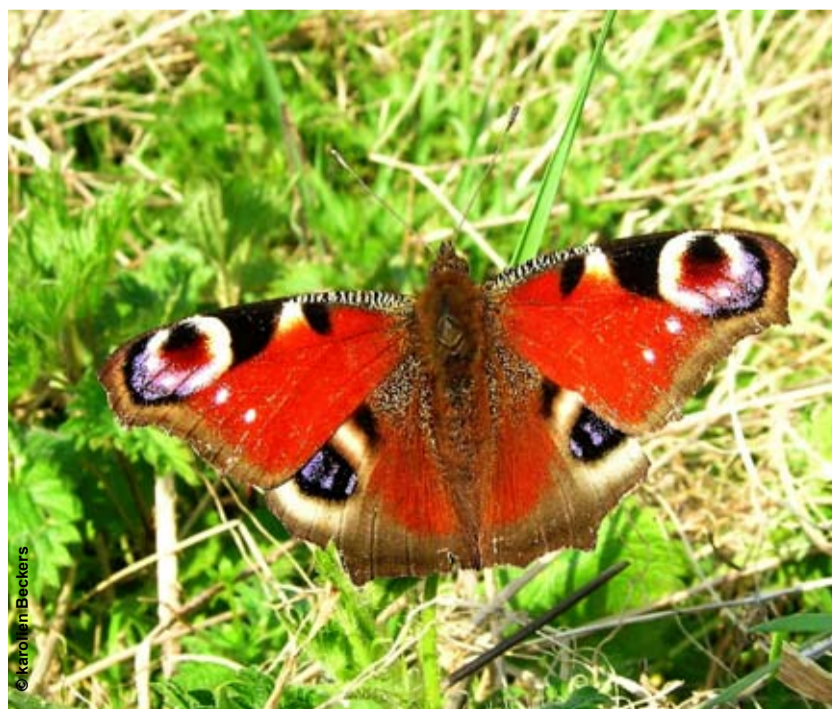
De Dagpauwoog is vaak te vinden op de vlinderstruik (Buddleja)

Dat is ook ongeveer alles wat we weten. Daar willen we echter iets aan veranderen om tegen 2009 voor Brussel een heuse 'vlinderatlas' uit te kunnen brengen. Iedereen kan er een bijdrage aan leveren: het enige wat u hoeft te doen, is elke vlinderwaarneming in een formulier te noteren, dat u via onze website kunt downloaden. Als het 'Butterfly Effect' voor een sneeuwbaaleffect kan zorgen, dan kan er geen twijfel over bestaan dat het eindresultaat ... ook een echt knaffect zal hebben!