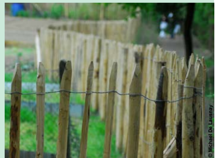
De nieuwe omheining in hout die vervaardigd werd met takken die ter plaatse gesnoeid werden

De bestaande wegen werden verbreed en hun directe omgeving vrijgemaakt. Zo kan elke bezoeker goed zien dat de site begaanbaar en onderhouden is. Maar de natuur blijft hier heer en meester. Naast de veelgebruikte paden, blijven ook het bos en de gemaakte weiden toegankelijk voor recreatiedoeleinden. Daarbij werd ook aan de fietsers en de personen met een beperkte mobiliteit gedacht door de aanleg van nieuwe, gemakkelijk toegankelijke paden. Ter aanvulling van het decor van dit geslaagde project werd ten slotte ook op een discrete manier voor nieuw meubilair gezorgd.