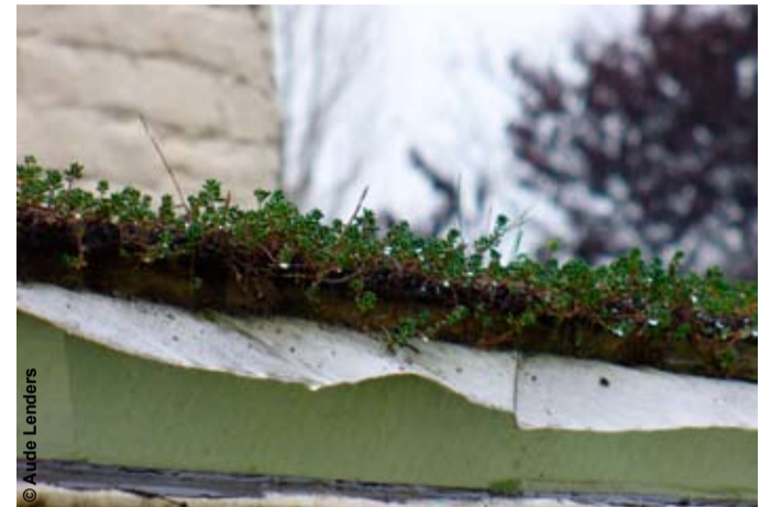
Vetplanten, aromatische gewassen, kruid- en grasachtige planten... zijn ideale planten voor een groen dak.

Het Brussels Wetboek van Ruimtelijke Ordening bepaalt dat alle verbouwingswerken aan een woning, ook al veranderen ze niets aan het volume van het gebouw in kwestie, onderworpen zijn aan een aanvraag tot stedenbouwkundige vergunning. Dat geldt dus ook voor de aanleg van groendaken. Neem daarom contact op met de stedenbouwkundige dienst van uw gemeente om te weten te komen, welke stappen u eventueel dient te ondernemen.