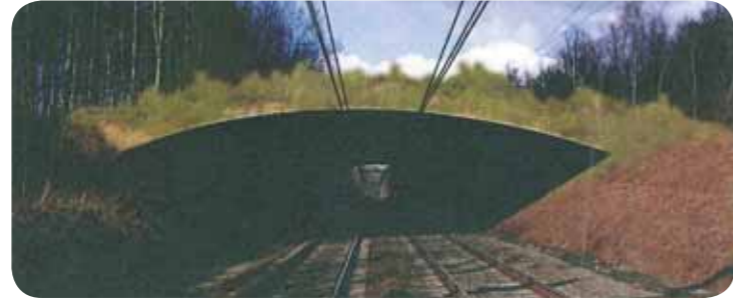
ontwerpschets ecoduct over Terhulpssteenweg en spoorlijn L161

Autobanen, snelwegen en een spoorlijn doorkruisen het woud. De sluiting en afschaffing van een aantal van die wegen, het herstellen van droogdalen, de aanleg van ecoducten zijn een greep uit de vele maatregelen die voorgesteld worden in de structuurvisie om het woud verder ecologisch en recreatief te ontsnipperen.