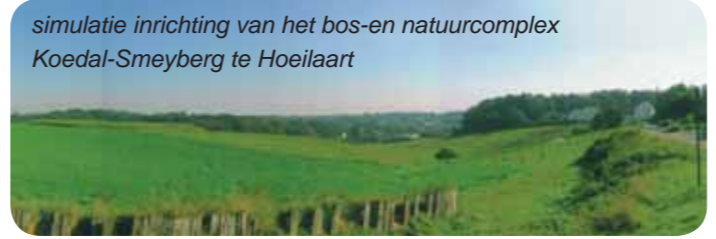
simulatie inrichting van het bos-en natuurcomplex Koedal-Smeyberg te Hoeilaart

Fietsroutes, ruit- en wandelpaden in het Zoniënwoud worden vernieuwd, verbeterd en krijgen een aantakking op lange-afstandsroutes buiten het woud (GR-paden, thematische fietsroutes, knooppuntennetwerken, enz.). De bestaande of nieuwe routes in het Zoniënwoud krijgen op die manier een beter recreatief aanbod, ook voor jongeren en personen met een handicap. De verbindingen met de omgeving en de landschapsecologische relaties met de valleien van Voer, Laan, IJse, Woluwe en Argentine worden waar mogelijk versterkt en via bosstapstenen aangesloten op de andere belangrijke boskernen die overblijven van het historische Kolenwoud: het Hallerbos, het Meerdaalwoud, enz.